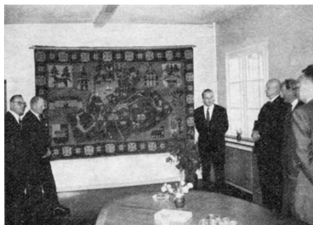
Wandteppich, Kreis Johannsburg Geschenk des Patenkreises Flensburg-Land