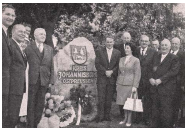
Gedenkstein im Garten des Landratsamtes Flensburg-Land. Der Stein ist dem Abstimmungsstein nachgebildet. Aufnahme am Tage der Einweihung.

Während der letzten Jahre wächst im Kreis Flensburg-Land der Fremdenverkehr zu einem Wirtschaftszweig, der immer größere Bedeutung gewinnt. Neben dem alten Ostseebad Glücksburg hat sich das Land weit dem Fremdenverkehr geöffnet. Von Kappeln bis Flensburg läuft eine großzügig angelegte Straße in etwa gleichem Abstand zur Ostsee durch den