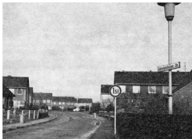
Johannisburger Straße in Tarp, Kreis Flensburg-Land.

Kreis. Sie hat eine frühere Nebenbahnstrecke ersetzt und das Land weit aufgeschlossen.