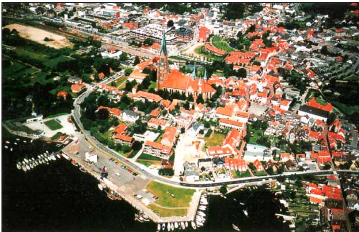
Schleswig / Kreis Schleswig-Flensburg – Die Altstadt mit Dom aus der Vogelperspektive