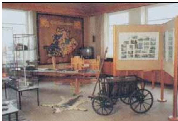
Blick in die Johanniskburger Heimatstube