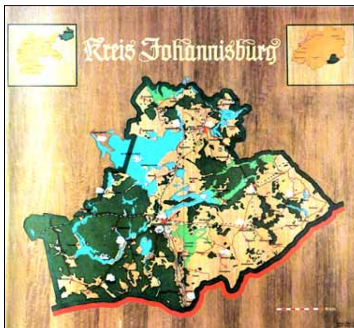
Die Karte – 2,60 x 2,30 m – hängt in unserer Heimatstube Entwurf: H. Otmar Bosk, Grafik: H. Schirdewann

1300 Besucher, davon 800 Johannisburger, genossen die unvergesslichen Flensburger Tage – dies nach nur einer Woche nach dem 25. Dortmunder Haupttreffen am 2. September!