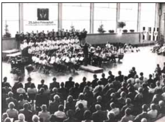
Feier des 25. Patenschaftsjubiläums

Die Jubiläumsfestlichkeiten im Kreis Schleswig-Flensburg auf und rund um den Scheersberg finden vom 7. bis 9. September mit einem Festprogramm zum Tag der Heimat am 9. September ihren Höhepunkt.