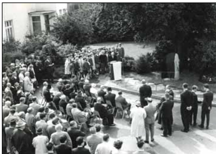
Der Gedenkstein im Garten des Landratsamtes Flensburg. Die Fotos entstanden am Einweihungstage