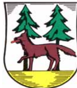
Kreis Johannsburg / Ostpr.