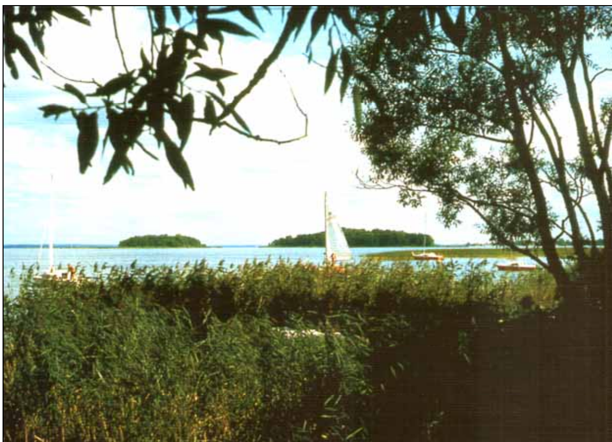
Die Inseln Spirdingwerder und Fort Lyck (Teufelswerder) auf dem Spirdingsee / Masuren

V.i.S.d.P.: Kreisgemeinschaft Johannesburg e.V.